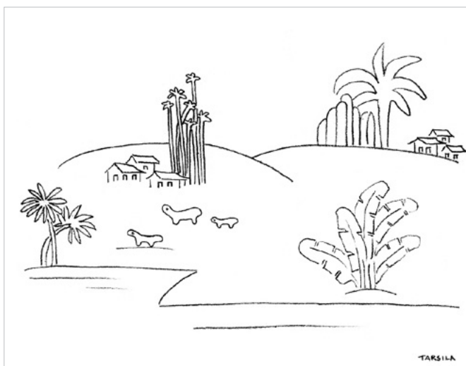
Tarsila do Amaral. Paisagem antropofágica - I , 1929 c – lápis s/ papel, 18,0 x 22,9 cm. Coleção Mário de Andrade. Coleção de Artes Visuais do Instituto de Estudos Brasileiros USP.

O novo tempo do mundo exige dos intelectuais responsabilidades que lhes são intrínsecas: a de tornar a força das ideias parte do movimento de entendimento e transformação do mundo. Os filósofos Otília Beatriz Fiori Arantes e Paulo Eduardo Arantes cumprem, juntos, há mais de 50 anos, a tarefa da crítica como intelectuais públicos atuantes, transitando entre diversas áreas das humanidades e da cultura, em diferentes audiências e espaços de formação. A coleção Sentimento da Dialética é um lugar de encontro com a obra de Otília e Paulo Arantes e reafirma o sentido coletivo da sua produção intelectual, reunida e editada em livros digitais gratuitos. É um encontro da sua obra com um público cada vez mais amplo, plural e popular, formado por estudantes e novos intelectuais e ativistas brasileiros. É também um encontro da sua obra com o movimento contemporâneo em defesa do conhecimento livre e desmercantilizado, na produção do comum e de um outro mundo possível.