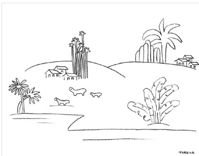
Tarsila do Amaral. Paisagem antropofágica - I, 1929 c – lápis s/ papel, 18,0 x 22,9 cm. Coleção Mário de Andrade. Coleção de Artes Visuais do Instituto de Estudos Brasileiros USP.