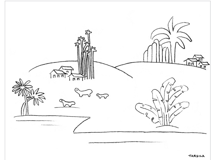
Tarsila do Amaral. Paisagem antropofágica - I , 1929 c – lápis s/ papel, 18,0 x 22,9 cm. Coleção Mário de Andrade. Coleção de Artes Visuais do Instituto de Estudos Brasileiros USP. Reprodução gentilmente cedida pela família e IEB USP.